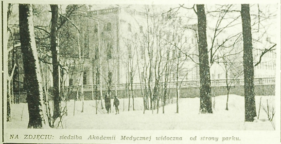
NA ZDJĘCIU: siedziba Akademii Medycznej w Białymstoku, od strony parku.