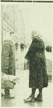
— Co dobrze słychać u szanowanej pani?

Takie rozmowy i upomnienia nie mogą oczywiście trwać w nieskończoność. Po jednorazowym czy dwukrotnym upomnieniu, jeżeli właściciel wykazuje lekceważenie nakazów czy wręcz złośliwie uchyla się od obowiązku odsinięcia, z całą bezwzględnością powinno się stosować ostrą represję w postaci wysokich mandatów czy też kierować wnioski do kolegium karno-administracyjnego. Nie możemy bowiem tolerować zwykłego niechajstwa i braku odpowiedzialności społecznej odpowiedzialności, w wyniku których ludzie łamią sobie ręce i nogi. Chcemy i musimy w naszym mieście stworzyć normalne warunki dla przechodniów i środków lokomocji zapewniając tym samym ludziom pełne bezpieczeństwo i normalne funkcjonowanie miejskiego organizmu. (jp)